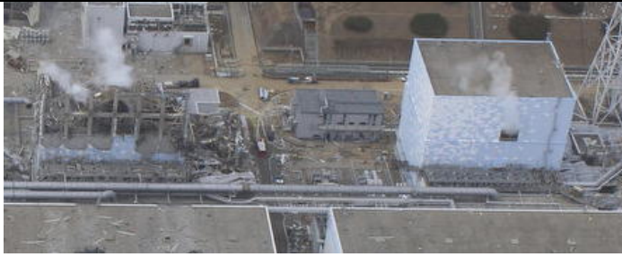
3月20日の航空写真（吉岡メモ No. 4 より再掲） 左が3号炉、右が2号炉でブローアウトパネルが開いているのが見える）