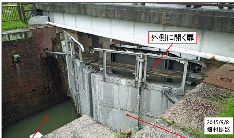
図5 船頭平閘門の扉

閘門の傍に、100年近く使われた実物の鉄板の閘門が展示されていた(図6)。幅約3m、高さ約7mの鉄板であった。1900年頃に作られたということが書いてあり、とても興味深かった。というのは、八幡製鉄がきちんと稼働して製品を出せるようになるまで、日本では大型の鉄板を作ることが出来なかった。1890年頃に日本古来の技術であったたたら製鉄は消滅する。それまで刀や農機具を使うのに使われていた地場の技術であるたたらでは、このような大きな鉄板や形鋼を作ることには出来なかった。大きな鉄板を作ることが出来ないから、日本では鉄船を作ることが出来なかった。日清戦争や日露戦争では大体イギリスを中心とするヨーロッパから買った戦艦で戦争をしたのである。その治水用のものがこの鉄板で、おそらく輸入した鉄板で作ったものだろう。厚さはおそらく10mmぐらいだったと思うが良く覚えていない。たとえば、山陰本線の余部鉄橋