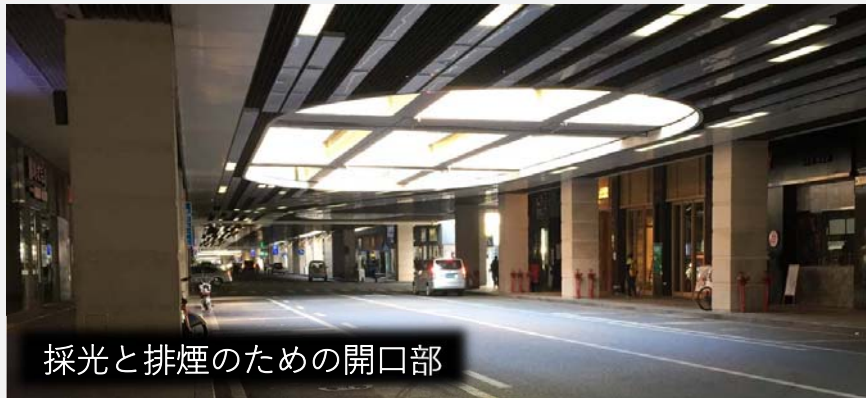
採光と排煙のための開口部