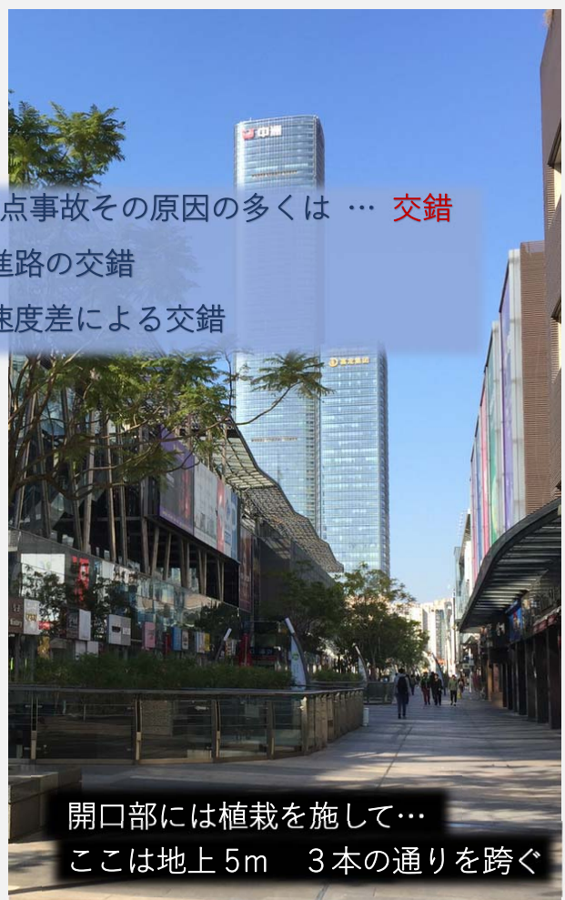
開口部には植栽を施して… ここは地上5m 3本の通りを跨ぐ