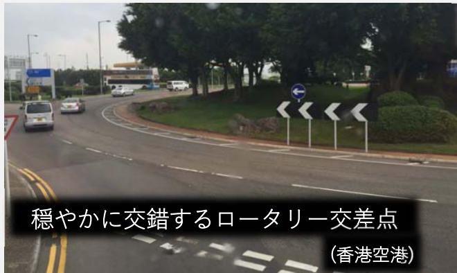
穏やかに交錯するロータリー交差点 (香港空港)