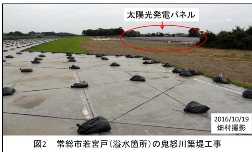
図2 常総市若宮戸(溢水箇所)の鬼怒川築堤工事

鬼怒川には自然堤防ができていた．自然堤防はどうやってできたのだろうか？ 川に土砂が堆積し，川が氾濫すると水によって運ばれた土砂が水の勢いが衰えた辺りに堆積し，それを繰り返すうちに流路の脇に小高い堤防ができる．これが自然堤防だと理解している．今回の洪水では，ある民間企業が太陽光発電所を作るときに自然堤防を破壊してしまった