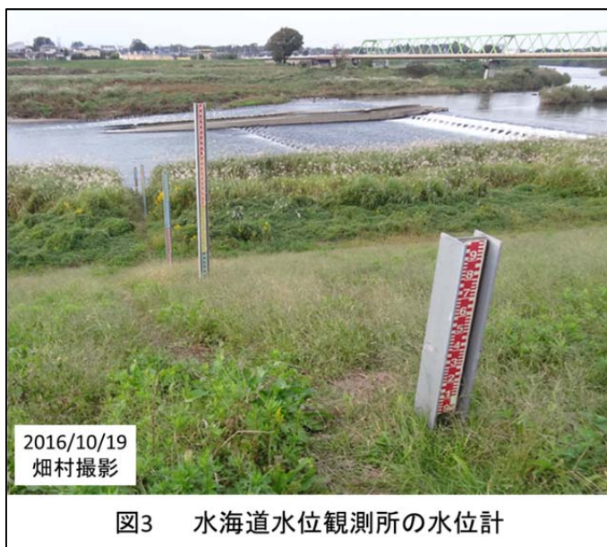
図3 水海道水位観測所の水位計

水位計の方式にいろいろあるということを知った。堤防の川表側に河川の流路から順番に堤防に向かって4本のH鋼が立てられており、各H鋼に1mずつに色分けした物差しが取り付けられていた（図 3）。これを目視、またはカメラで見てその時々々の水位を読むのだそうだ。他に、フロート式水位計、水圧式水位計、超音波水位計もあるという説明だった。この超音波水位計については、立山カルデラの湯川の白岩砂防ダムところで水位の測定に使われている実物を見たことがある。