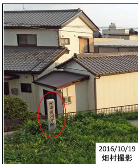
図6 水海道水位観測所の脇にある河岸跡の石碑

水位観測所の脇に昔ここに河岸があったという標識が立っていた(図6)。江戸時代の船はどのような構造だったのだろうか？日本の河川のような急流で船による輸送をしようとする、船は底が浅くなければならない。河川の掘削をして水路を作るということをやっていたら、船の構造も底が平らな船だったのではないかと思う。推進源は多分帆だったのではないかという話だったが、そう都合よく風が吹くわけでもないから、棹も使ったに違いない。私自身が鳥取に疎開していた時の経験から、棹を使うのかと思ったが、大きな船の場合は棹では無理だろう。水路の脇で人や牛馬が引いたのではないだろうか。すると、牽引用の側道があったに違いない、と思った。注意して