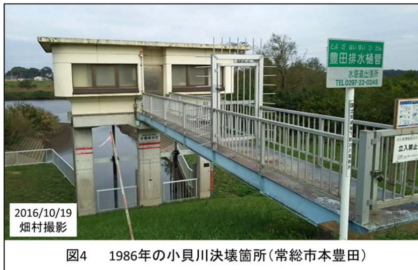
図4 1986年の小貝川決壊箇所(常総市本豊田)

も 1m 低かったそうだ. それに反して, 鬼怒川の水位は観測史上最高といわれている. ここで大事なのは, 人がそれぞれ考える中身や着目点はその人が経験した範囲内にほぼ限られるということである. しかも着目している期間は 30 年が限度で, それ以前のものはよほど大きな事柄でないと記憶に残らない. 自然災害に備えた対策を立案したり, 避難や準備を住民に伝達したりする際には, 立案者がこのような人の特性を知っておかなければならないと思う.