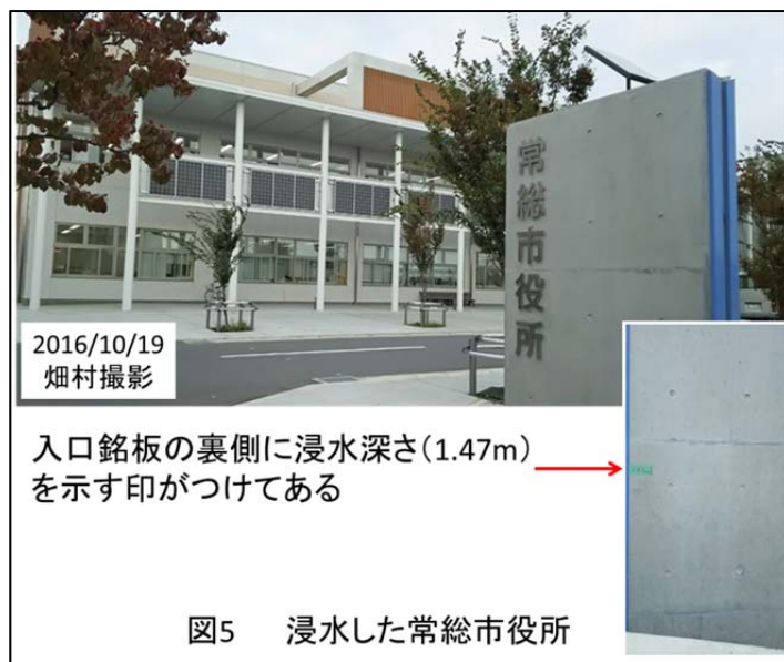
図5 浸水した常総市役所

今回の水害で被災した市役所を外部から見学し, 市役所でどのようなことが起こったかの説明を聞いた (図 5). 非常用電源は 1 階レベルに設置されていたので, 水没して使うことができなかったそうだ. 私はこの話を聞いて, 原発事故の想定と同じ現象が起こったのではないかと感じ, 洪水の水位を考えない立案者がおかしいと感じた. しかし, 人間の特性を考えるとやむを得ないことかもしれないとも思う. ただ, そうなってしまうということだけは知っておくべきだと思った. 関係者の頭の中まで見ないと, 真の対策や準備はできない. 平成の大合併で常総市ができた (2006 年に水海道市と石下町が合併して誕生) が, 非常用電源の立案者が小貝川の洪水の経験者であれ, これまで洪