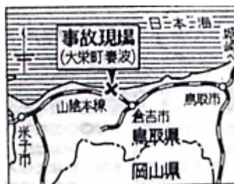
図 - 1：位置図