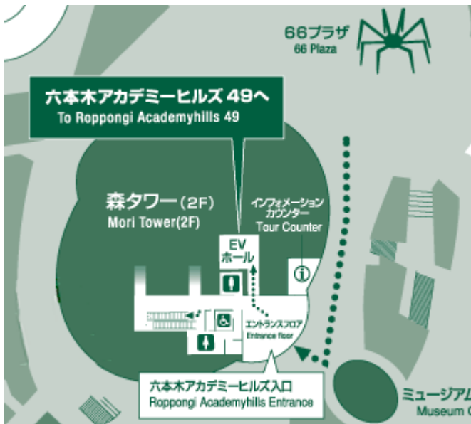
49階へ行くエレベータ入り口