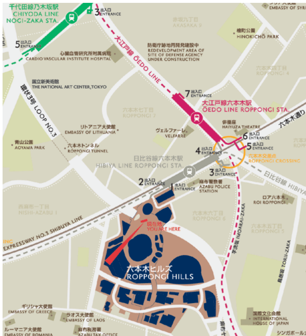
六本木ヒルズ周辺図

http://www.roppongihills.com/jp/map/area_map/index.html