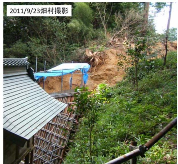
2011/9/23図41 諏訪神社社殿脇の姥杉の伐採跡 (推定樹齢約500年、昔慶長津波で流された船が繋がれたという言い伝えがある。)