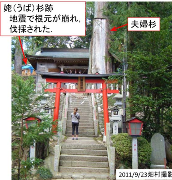
2011/9/23図40 相馬市の黒木諏訪神社