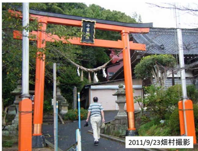
図43 岩沼市の千貫神社 (慶長津波の伝承がある)

その後、北上し岩沼市の千貫神社へ行った(図43)。津波伝承の残る千貫神社は常磐線と東北線の分岐点から少し西に行った、阿武隈川沿いにある千貫山の麓に建っている神社である。慶長津波の折、千貫山の頂上にある松並木につかまって漁師が難を逃れたという伝承の松並木は今はない。この近所の住人の説明では、千貫神社は他の神社と合祀して、普段は無人になっており、神主は他の場所から来るそうだ。今回津波はここまでは来なかったということである。