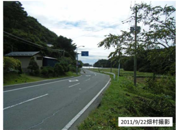
前方から津波が来る前に、老婦人は孫に促されて標識左上の小学校に歩いて避難したという。