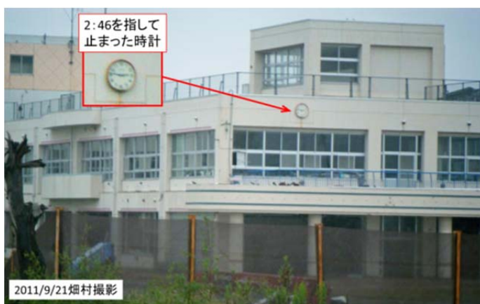
図8 仙台港付近の七北田川河口に近い中野小学校

次に沖の石のすぐ近くの小高い丘の上にある「末の松山」を見に行った(図10, 11)。これは百人一首の「契りきなかたみに袖を絞りつつ 末の松山 波越さじとは」という句に出てくる「末の松山」だそうだ。このすぐ下のところまで水が来たというので行って見たが、近くの商店や会社などは復旧していた。これらの建物には地面から高さ2m位のところに津波の痕跡があったが、この程度の浸水ならば家は流されず、修理すればまた使えるようになるということらしい。