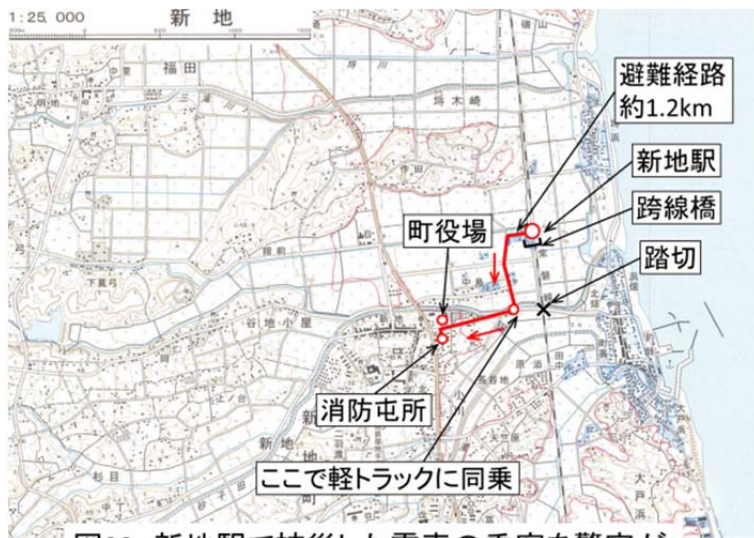
図32 新地駅で被災した電車の乗客を警官が避難誘導した経路