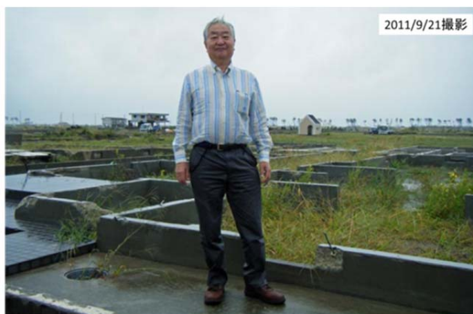
図4 仙台東部道路より海側の地区 ～津波でことごとく流され、建物の土台だけが残っていた～

その後、名取川の対岸に戻り、河口付近にある「五柱(ごばしら)神社」を見た(図6)。津波で一旦流されたが、新しく小さな祠(仮宮)ができていた。神社を復活させるというよりも、心の