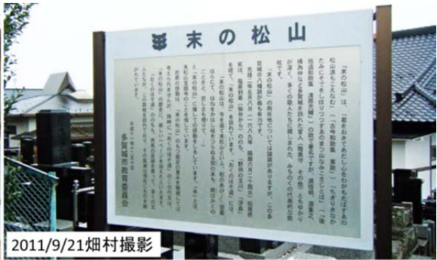
図11 多賀城市の末の松山の説明板 (契りきな 形見に袖を 絞りつつ すゑのまつ山 なみこさじとは)