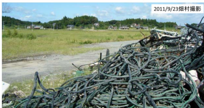
図29 津波に流された新地駅から北方向を見る 小高い丘の麓に民家がある。私ならこちらの方向に逃げただろうと思った