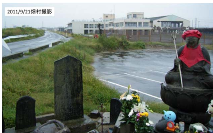
図7 仙台港近くの念仏田, 遠くに見えるのは中野小学校 (津波にもかかわらず石碑や仏像は残っていた。)

海岸沿いを北上して仙台港の近くまで行った。七北田川の河口付近にある中野小学校のそばに「念仏田地蔵」が祀ってあった(図7, 8)。この様子を見て、このような災害に遭った人々は神仏を祀りたくなる非常に強い願望を持つのではないかと感じた。