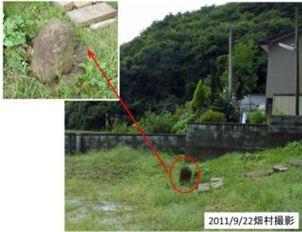
図13 奥松島の宮戸島で見た津波による被災者を弔う小さな石碑