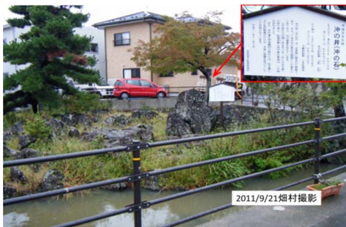
図9 多賀城市の“沖の石”(または“沖の井”) “沖の石(沖の井)”の説明板にある歌 「おきのゐて 身をやくよりも かなしきは 宮こしまへのわかれなりけり」 「わが袖は しほひにみえぬ おきの石の 人こそしらね かわくまぞなき」