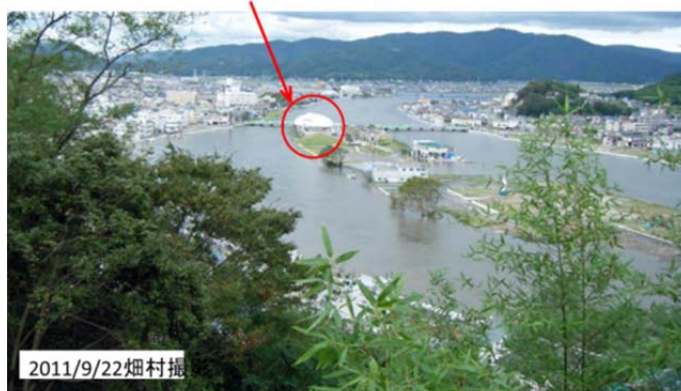
図23 石巻市の日和(ひより)山より旧北上川河口付近を見る