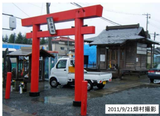
図3 仙台駅東2kmの所にあった浪分神社