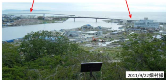
図22 石巻市の日和(ひより)山より石巻港を見る