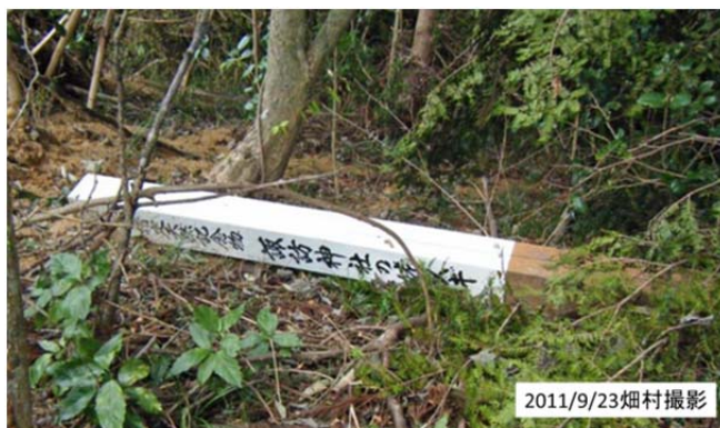
図42 諏訪神社社殿脇の姥杉の伐採跡に残された標柱

り、社殿は道路から約10m位上ったところにあり、大銀杏や夫婦杉は残っていたが、伝説に出てくる「姥杉」という杉の巨木は伐採されていた(図38, 39, 40)。偶然ここの宮司さんが説明してくれたが、姥杉は標高15m程度で、社殿の脇にあったそうである。ところが、東日本大震災の折、地震でこの姥杉の生えていた部分の擁壁が崩れ、社殿に倒れ掛かる危険があり、致し方なく伐採したということである(図41, 42)。相当大的な木だったらしく、伐採も重機を必要とする大変な工事だったようである。擁壁を作り直して姥杉を残そうとすると、費用がかかり過ぎて、この神社の氏子約600世帯で負担するのは無理が多いとあきらめたようだ。残念なことだが致し方ない。