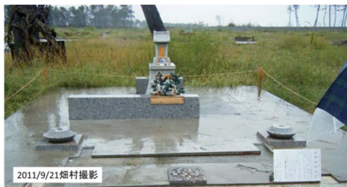
図6 名取川北岸の海岸付近にある五柱(ごばしら)神社の仮神殿