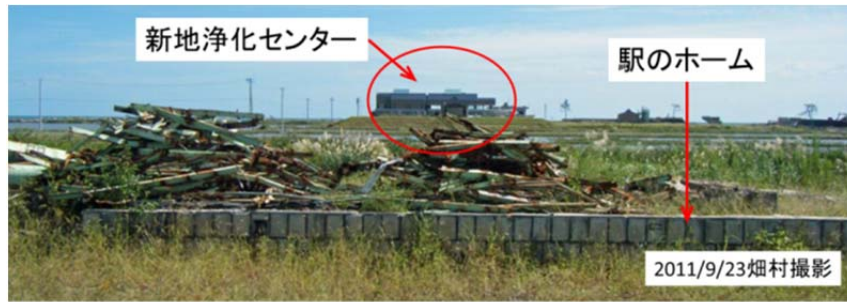
図28 津波に流された新地駅のホームから東方向(海岸方向)を望む