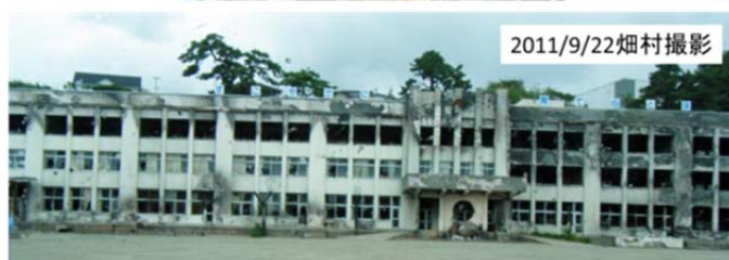
図24 石巻市の日和(ひより)山下の門脇小学校(津波襲来後に発生した火災で焼かれた)