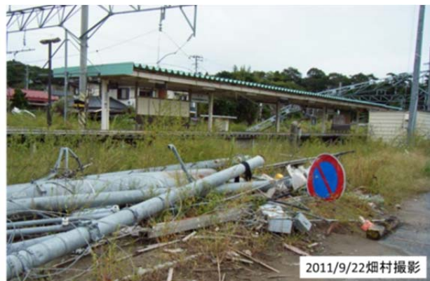
図18 津波襲来後のJR仙石線野蒜(のびる)駅