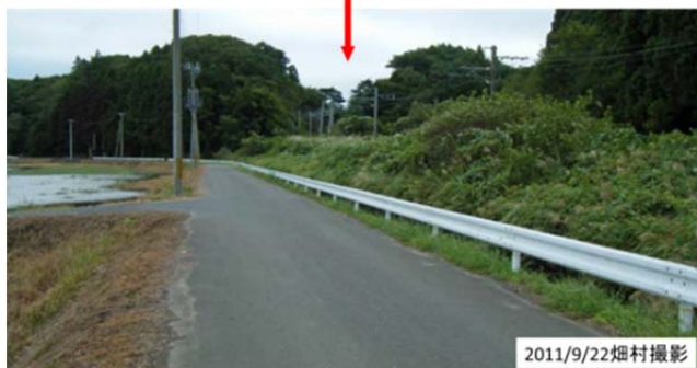
図17 地震時に電車が停車した切通し