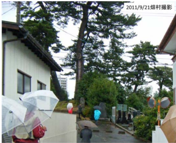
図10 多賀城市の末の松山 (住宅街に小高い丘があり、松と碑があった)