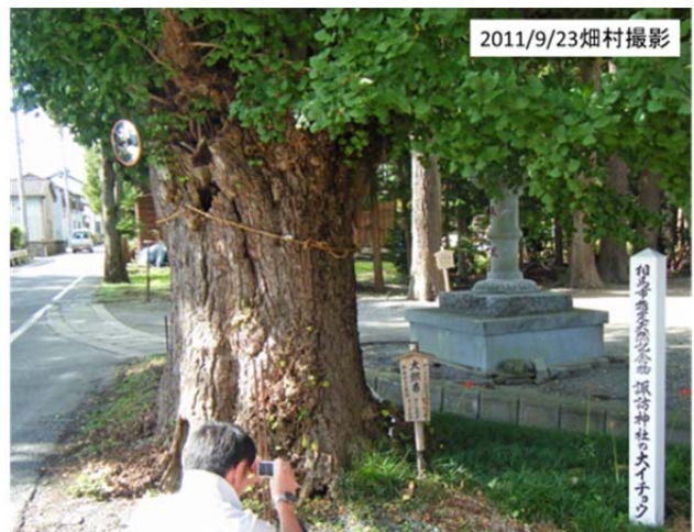
2011/9/23 図39 相馬市の黒木諏訪神社入口の大銀杏