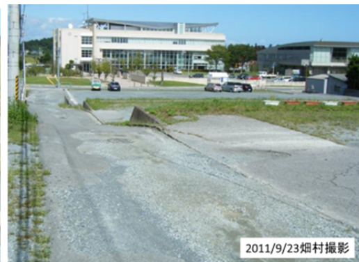
図36 乗客が避難した新地町消防団屯所から新地町役場を見る