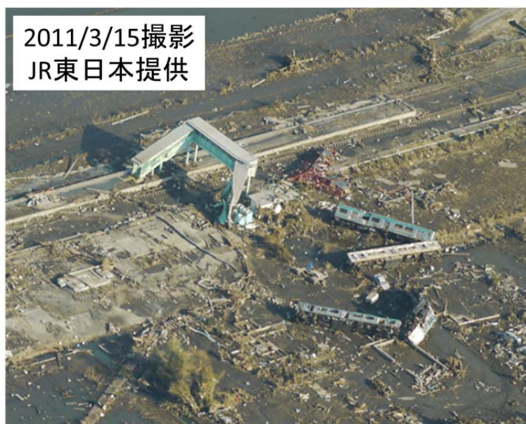
図46 常磐線新地駅で津波で流された電車

新地駅の入り口のあった位置に海を背にして立つと、北西に約500m離れたところに小高い丘があり、そこに民家が数軒建ってい