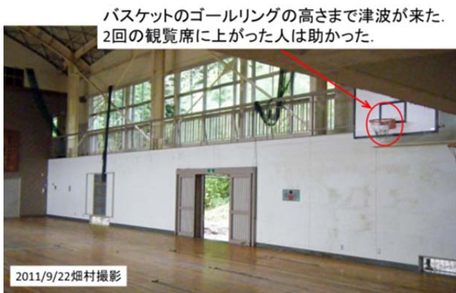
図20 乗客が避難した指定避難場所の野蒜小学校体育館

バスケットのゴールリングの高さまで津波が来た。2回の観覧席に上がった人は助かった。