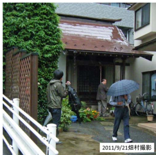
図2 仙台駅東側の民家の一隅にある浪切不動

次に「浪分神社」に行った(図3)。ここはグーグルによれば、標高が6～7mである。由来を聞くと、この神社はもっと東側(海側)にあったが、慶長津波が二つに分かれて引いた場所に社を移し、津波よけの神社としたということである。今回の津波は仙台東部道路に遮られてここまでは到達していない。