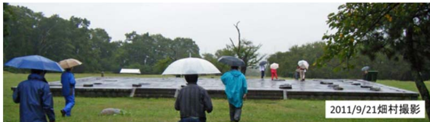
図12 724年に築城された多賀城跡

次に、多賀城址に行った(図12)。おそらく標高40m程ではないかと思うが、丘の上の森の中に昔の多賀城の跡があった。多賀城の礎石が奈良の平城京の跡にそっくりなのに驚いた。