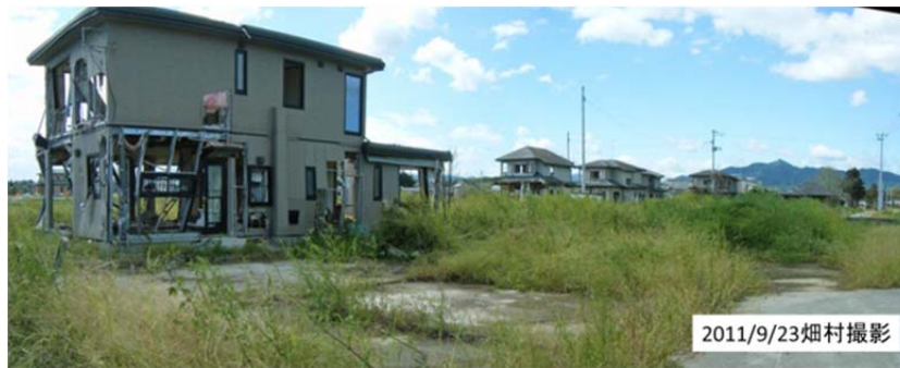
図34 新地駅から消防団屯所までの避難経路沿いの民家