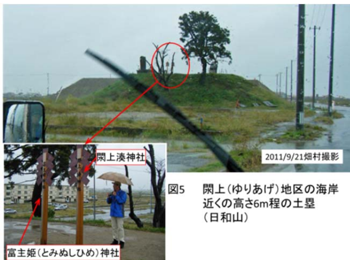
図5 閑上(ゆりあげ)地区の海岸 近くの高さ6m程の土塁 (日和山)