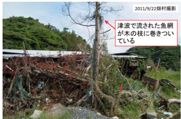
図15 奥松島の月浜地区

小学校の前を通過して大浜に向かう道路を進んで行くと、道路が冠水してそれ以上進めなくなった。そこで、月浜というところに行ってみた。この周辺はまだ全く瓦礫が片付いていなかった。海面から3mくらいの木の枝に漁網が引っかかっていたので、この辺りはその程度の津波に襲われたことがわかった(図15)。そのすぐ裏に作業場があったが、作業場は大破しており、鉄骨だけが残っていた。