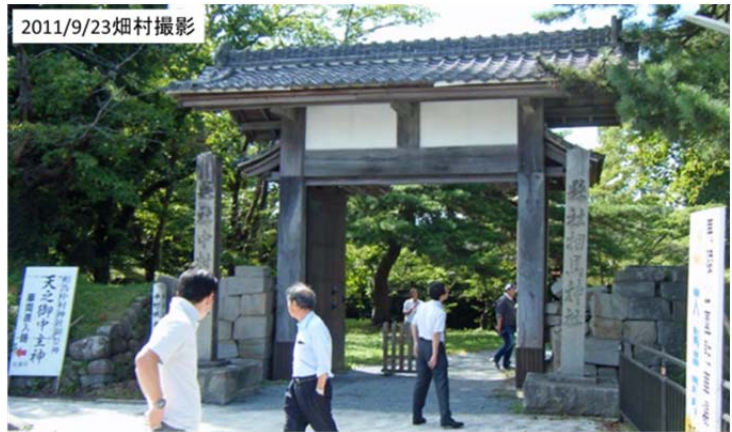
2011/9/23図37 相馬市の中心部に近いところにある中村城跡