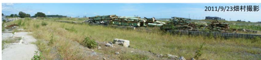
図27 津波に流されて線路も駅舎もなくなった JR新地駅から北方向を望む