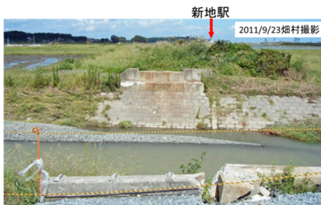
図35 橋梁が流されたJR常磐線の鉄橋跡 (手前の橋脚脇に踏切があり、海側から避難する車が渋滞した.)