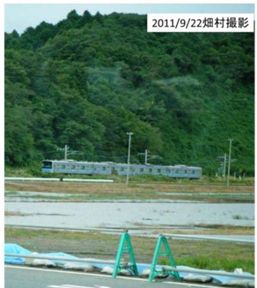
図16 仙石線野蒜(のびる)駅付近で津波に遭遇し、低地に留置されている4両編成の電車

9時過ぎに仙石線の野蒜駅近くに行った。地震の時に仙石線の電車は上下それぞれ1編成が野蒜駅付近を走行していたそうだ。そのうち上り電車は野蒜駅のすぐ手前の切通しの高みに停車したが、そこは他に比べて高いので、電車を移動させずにそのままそこにいた方が良いという乗客の勧めに従って、そこから動かずにいたために乗客・乗務員全員が助かったとのことである。もちろん電車も無事で、4両編成の電車がその切通しのところから低い平坦なところに降ろされて留置されていた(図16, 17)。電車は放置しておくともブレーキの力が全くなって危険なので平らな所に降ろしたとのことである。電車の車輪は車止めでレールに固定して止めてあった。また、この辺りでは線路沿いの架線柱が傾き、架線が大きく弛んでいた。