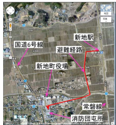
図33 電車の乗客を警官が避難誘導した経路