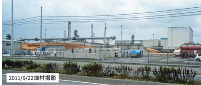
図25 石巻湾に面した日本製紙石巻工場

石巻市の人口の約1割にあたる4000人が亡くなったこと、その多くはこの石巻の市街地の住民であること、石巻市は6つの自治体の町村合併でできているので、同じ石巻といっても三陸のように津波に対する意識が高い地域と、石巻湾に面してひらけており津波に対する意識が低い地域があるという話を聞いた。