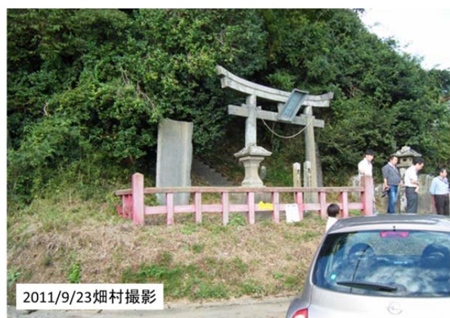
図44 名取市の清水峯(すずみね)神社 (貞観津波の伝承がある)

その後、東進し、仙台空港に行った。仙台空港の1階には床から3mくらいのところに浸水高さを示す印が付いていたようである。現在はほとんど復旧していたが、車